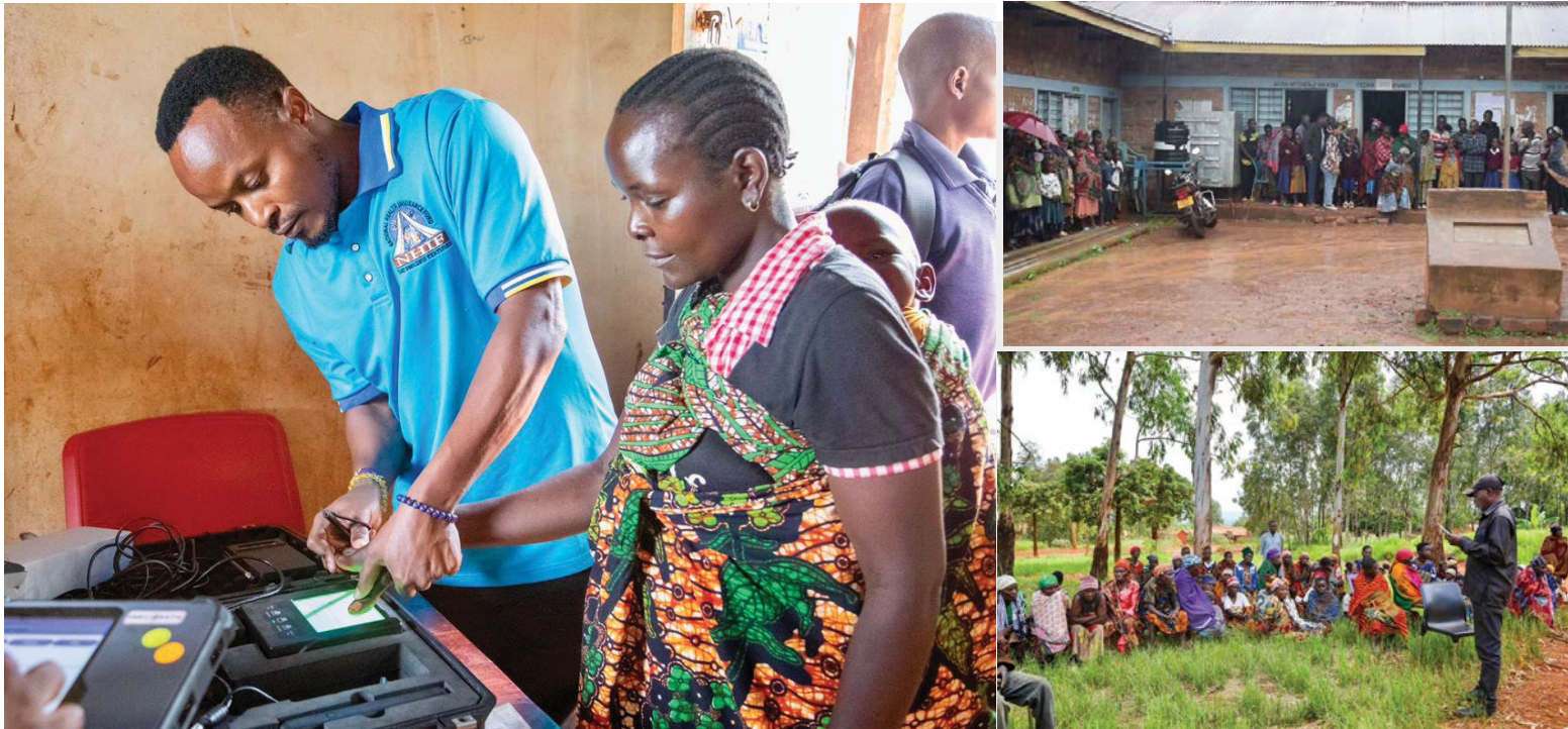
Wakazi wa Kijiji cha Ruyenzi, Kata ya Kiziguzigu, Wilaya ya Kakonko wakisajiliwa na kupatiwa bima ya afya kupitia mpango wa Bima ya Afya kwa Wote kwa kaya zisizo na uwezo