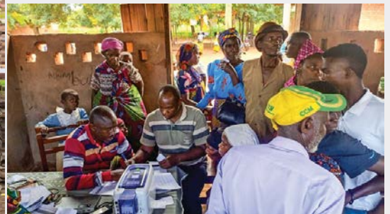
Wakazi wa Kijiji cha Kilimahewa, Kata ya Shanwe, Manispaa ya Mpanda wakiwa wamepatiwa kadi zao za bima ya afya kupitia mpango wa Bima ya Afya kwa Wote kwa kaya zisizo na uwezo.