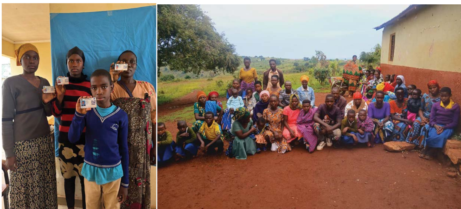
Wakazi wa Kijiji cha Nyakatale wilayani Kyerwa, Kagera wakionesha kadi za matibabu walizopewa kupitia mpango wa Bima ya Afya kwa Wote kwa Kaya zisizo na uwezo