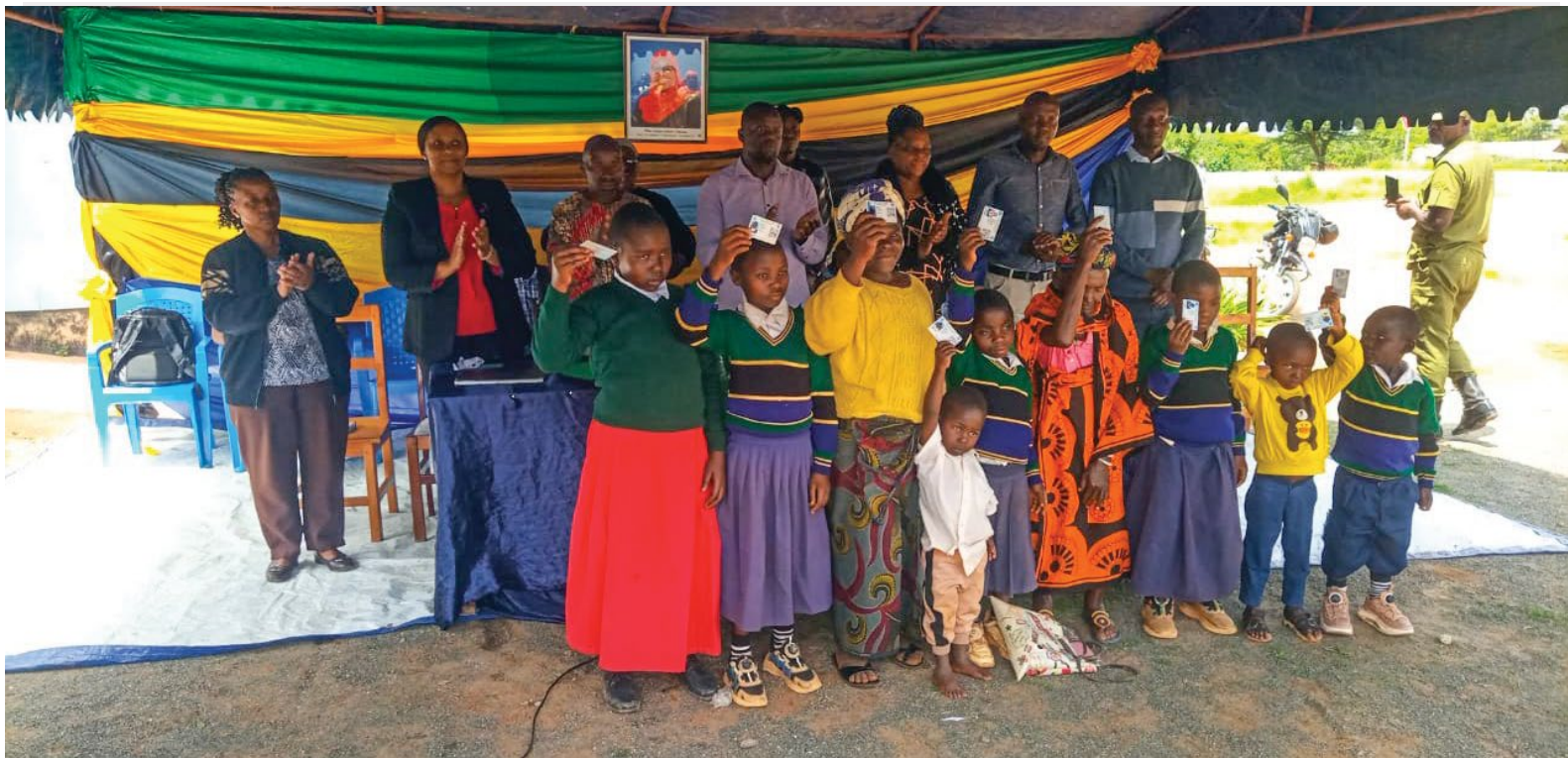
Wakazi wa kata ya Nyololo wilaya ya Mufindi, wapatiwa kadi za bima ya afya kwa kuanza na kaya zisizo na uwezo.