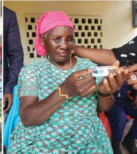
Sehemu ya Wazee kutoka Kijiji cha Sukamahela, Manyoni wakionyesha kadi za matibabu walizopata kupitia mpango wa usajili wa Kaya zisizo na uwezo