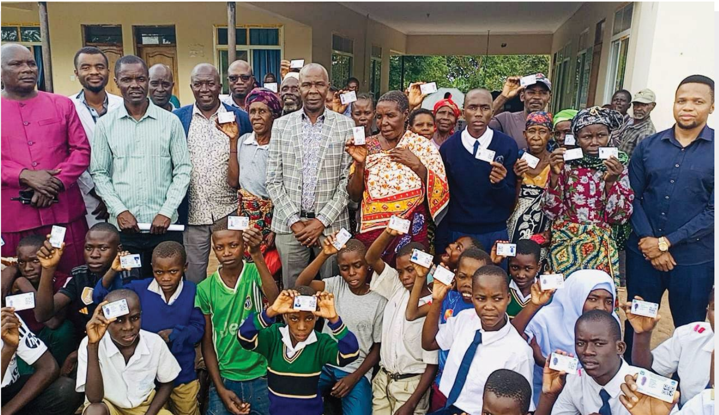
Wakazi wa Wilaya ya Kwimba wakiwa na kadi zao za Bima ya Afya baada ya usajili kupitia mpango wa Bima ya Afya kwa Wote kwa kaya zisizo na uwezo