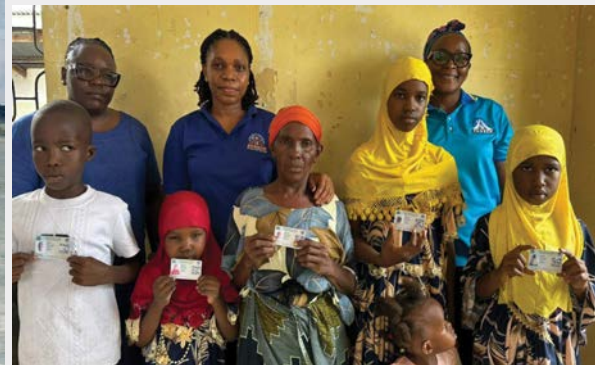
Wakazi wa Kata ya Tabata katika Halmashauri ya Jiji la Dar es Salaam baada ya kupatiwa kadi za matibabu