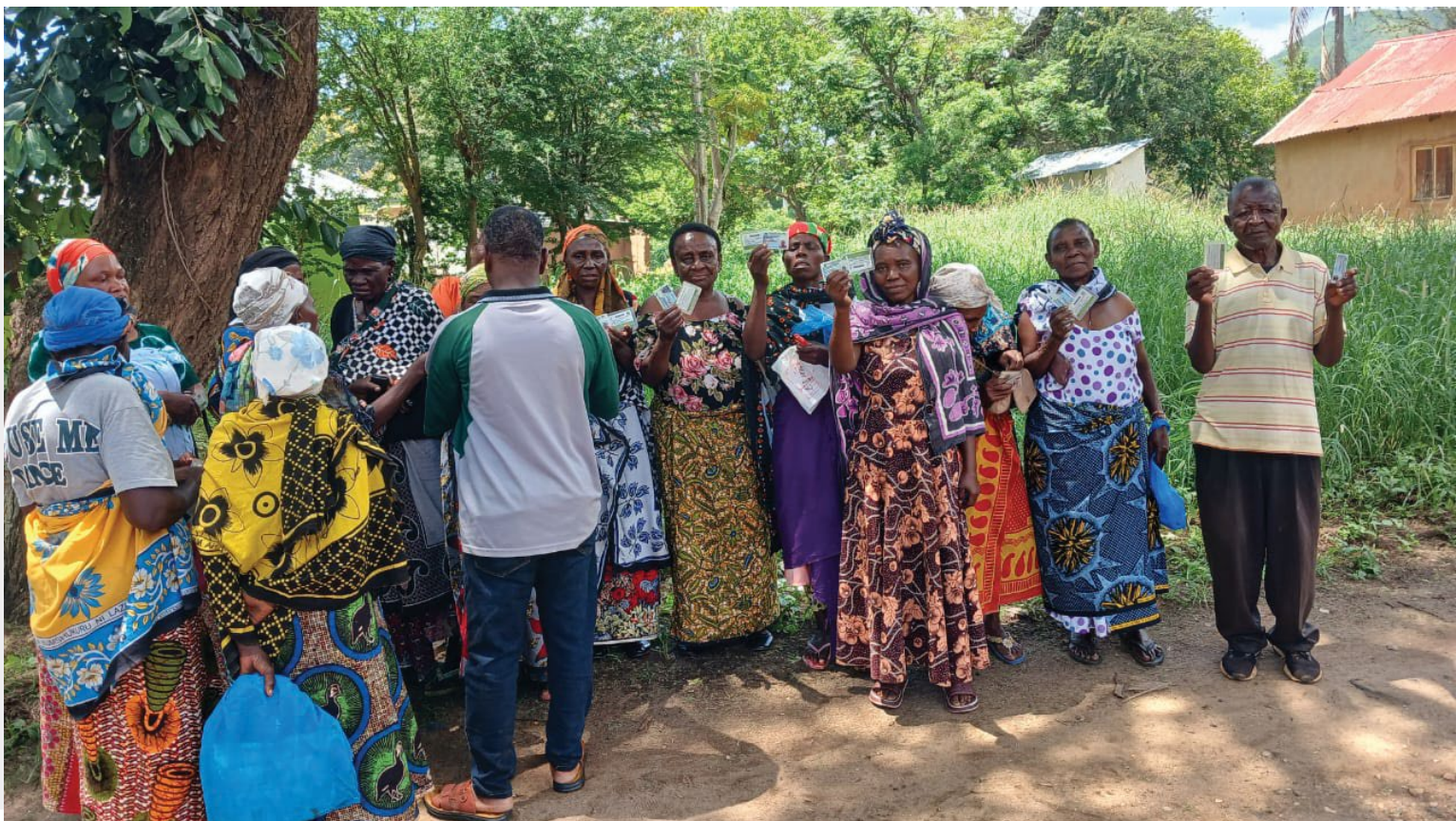
Wakazi wa Wilaya ya Mpwapwa wakiwa na kadi zao za Bima ya Afya baada ya usajili kupitia mpango wa Bima ya Afya kwa Wote kwa kaya zisizo na uwezo