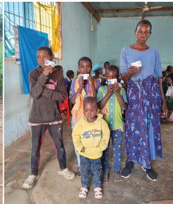
Wakazi wa Kata ya Nyijundu, Wilaya ya Nyang'wale wapatiwa kadi za bima ya afya kwa kuanza na kaya zisizo na uwezo.