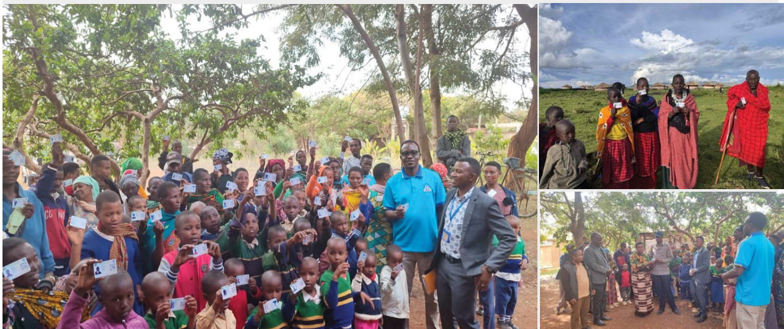
Wanufaika kutoka Wilaya ya Karatu wakiwa na kadi zao za Bima ya Afya baada ya usajili kupitia mpango wa Bima ya Afya kwa Wote kwa kaya zisizo na uwezo