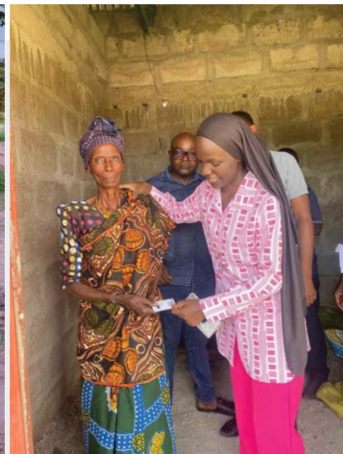
Wakazi wa Kijiji cha Ihayabuyaga, Kata ya Shigala, wapatiwa kadi za bima ya afya kwa kuanza na kaya zisizo na uwezo.