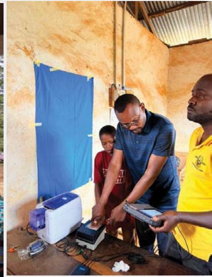
Wakazi wa Kijiji cha Mzundu, Kata ya Ndolwa,-Wilaya ya Handeni wakielimishwa kuhusu bima ya afya kwa wote na kupatiwa kadi za bima ya afya