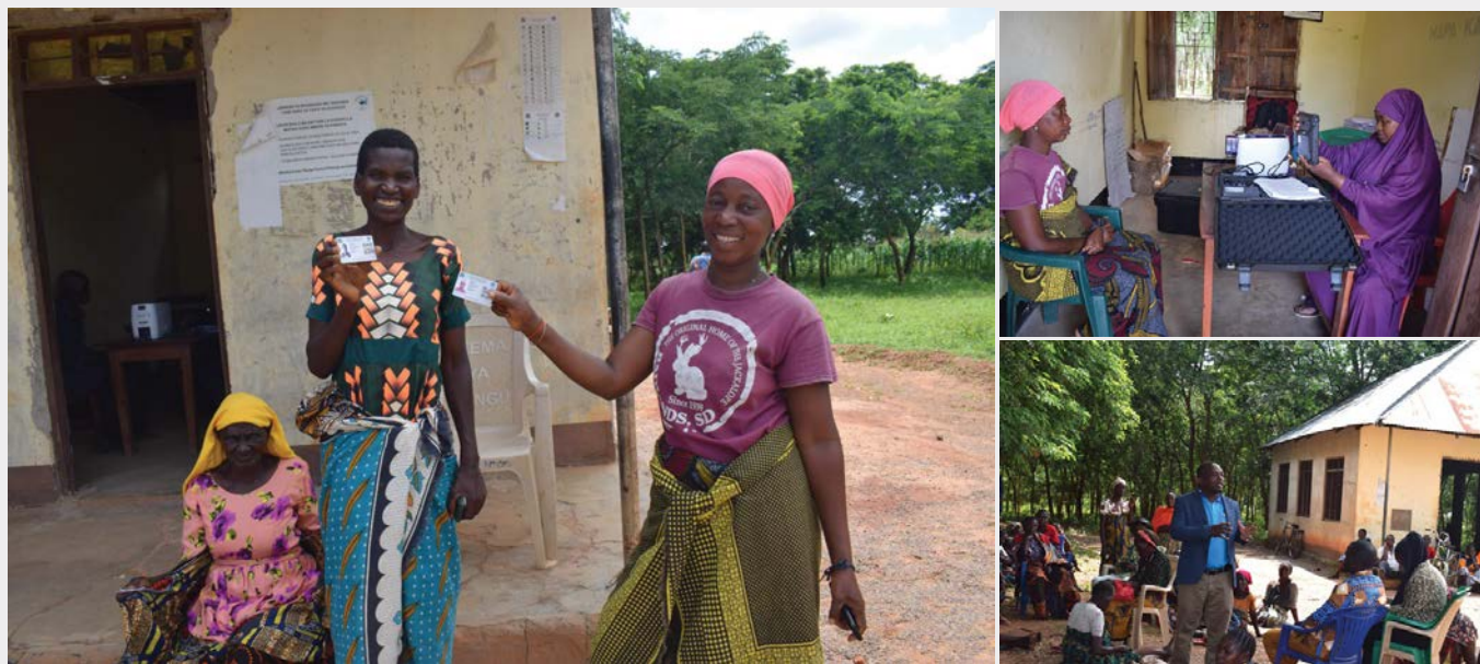
Wakazi wa kata Igwisi wilaya ya Kaliua wakiwa wamepatiwa kadi zao za bima ya afya katika zoezi la usajili wa kaya zisizo na uwezo lililofanyika wilayani hapo