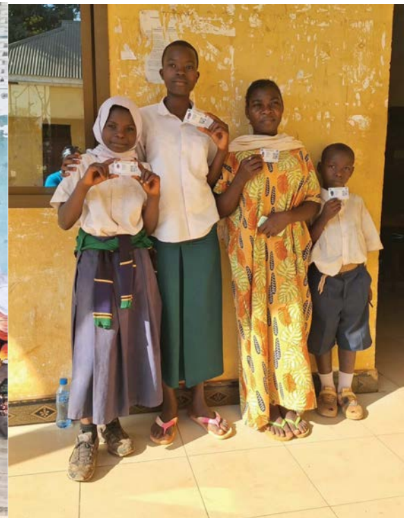
Wananchi kata ya Beleni Wilaya ya Mafia wakiwa wamepatiwa kadi ya bima ya afya